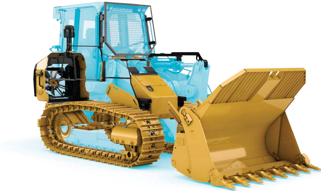
963K WH in figura.

Appositamente realizzato per le prestazioni